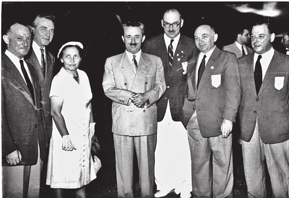
Eugen Justice v roce 1947 v čele palestinských sportovních funkcionářů